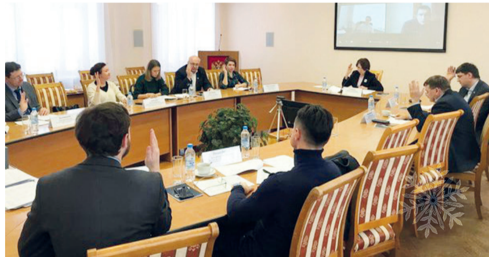
↑ Заседание компетентного жюри

В Кузбассе подвели итоги областных конкурсов «Лучший аспирант», «Лучший студент», «Лучшая монография» и «Лучший учебник (учебное пособие)» 2022 года. Организатором конкурсов выступило Министерство науки и высшего образования Кузбасса. Среди победителей – преподаватели, аспиранты и студенты СибГИУ.