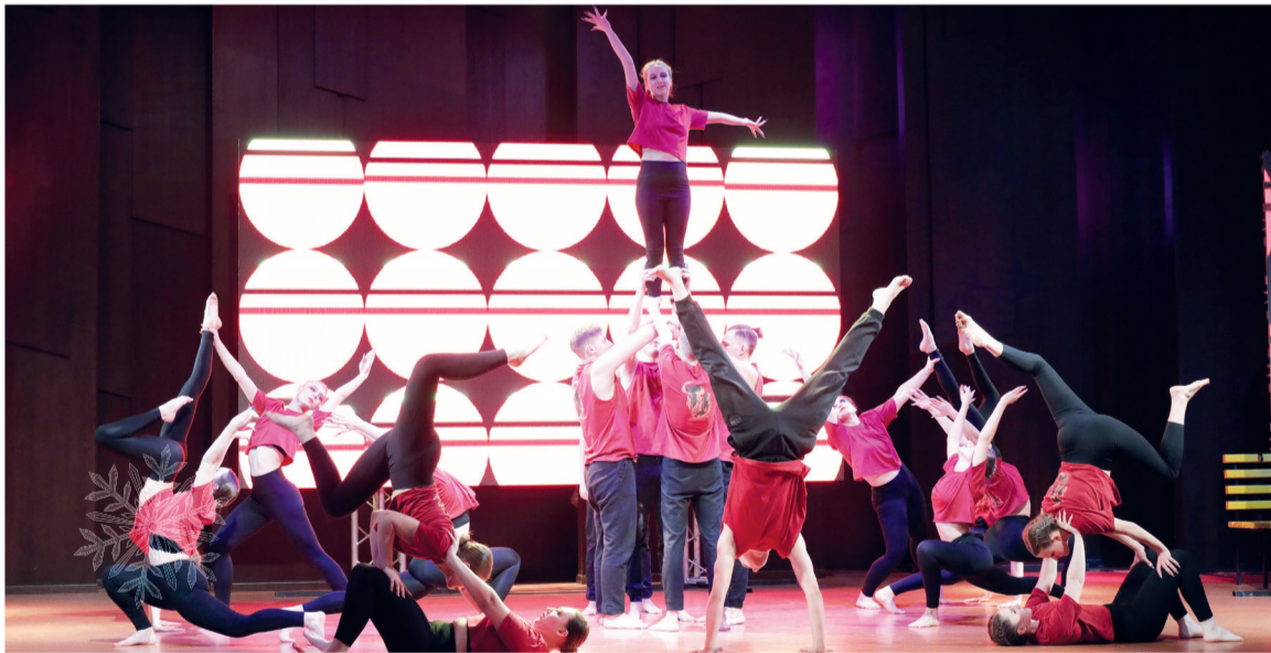
↑ Вот это "Первый шаг"!

Первокурсники за два месяца сумели подготовить отличную программу. Репетирующих студентов можно было встретить везде: в рекреации поточных аудиторий, в аудиториях и коридорах главного корпуса, спортзалах.