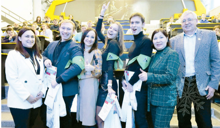
↑ Команда-победитель, успешно решившая задачи

Три дня в СибГИУ проходили "Дни Распадской". За это время школьникам и студентам Кузбасса удалось не только послушать лекции от экспертов РУК, но и посетить мастер-классы, пройти увлекательные квесты и мини-тренинги, а главное - поучаствовать в Инженерном чемпионате "ECODOKS". Цель чемпионата - популяризация инженерных профессий, стимулирование творческого роста, выявление одаренной молодежи и формирование кадрового резерва для исследовательской, административной и производственной деятельности.