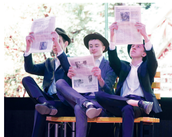
↑ Даже на сцене читаем свою газету!

3 место - Институт экономики и менеджмента