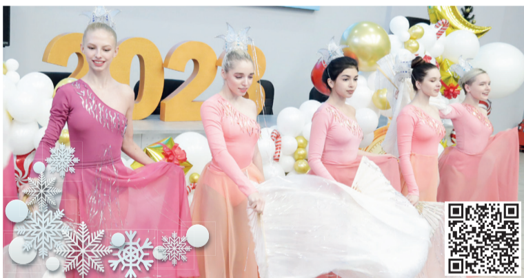
↑ Ректорский прием студентов. Больше фотографий ВКонтакте. Сканируй! Смотри!

Всё ближе Новый год. И как говорят китайские астрологи, это будет Год черного водяного кролика или кота... Стоп! Целый год - черного кота?! Кто из нас украдкой не сплевывал через плечо, когда дорогу перебежал черный кот! И теперь это будет продолжаться целый год?! Или, может быть, пора изменить своё отношение к суевериям? Мы вам о них расскажем, но вы не верьте! Это всего лишь шутка.